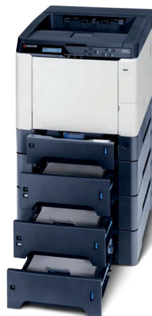
Foto toont product incl. opties